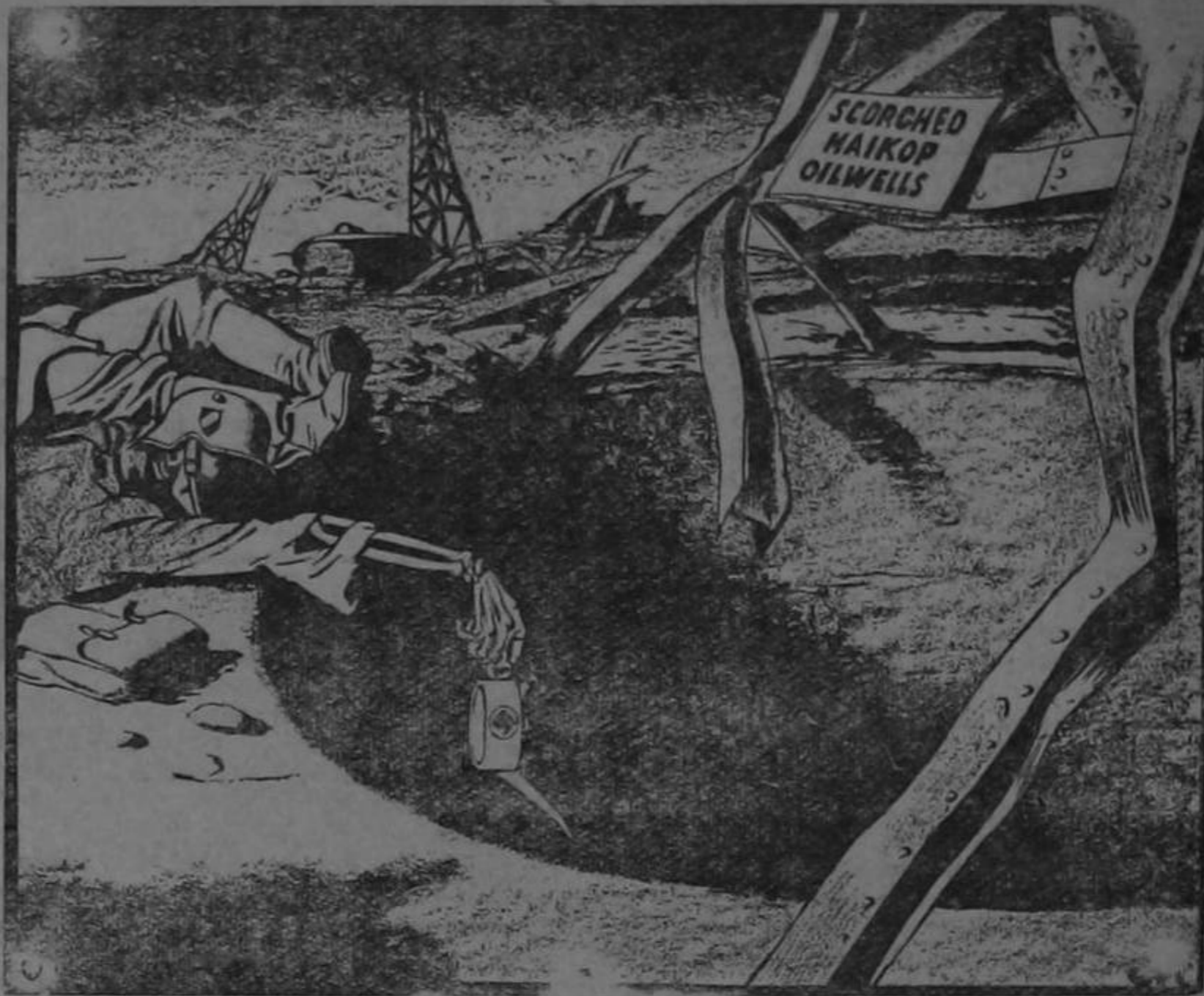
Tan seco como un hueso.