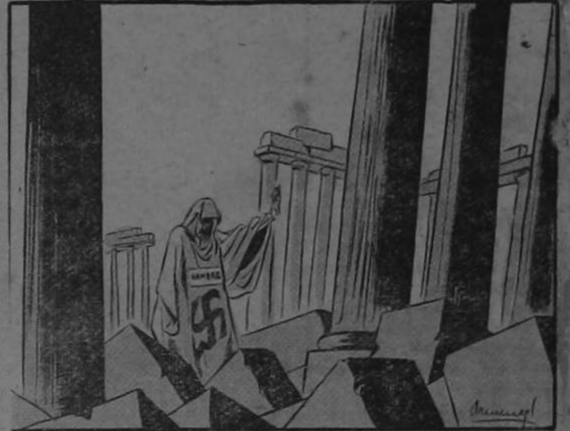
EMBAJADOR DE BERLIN EN ATENAS