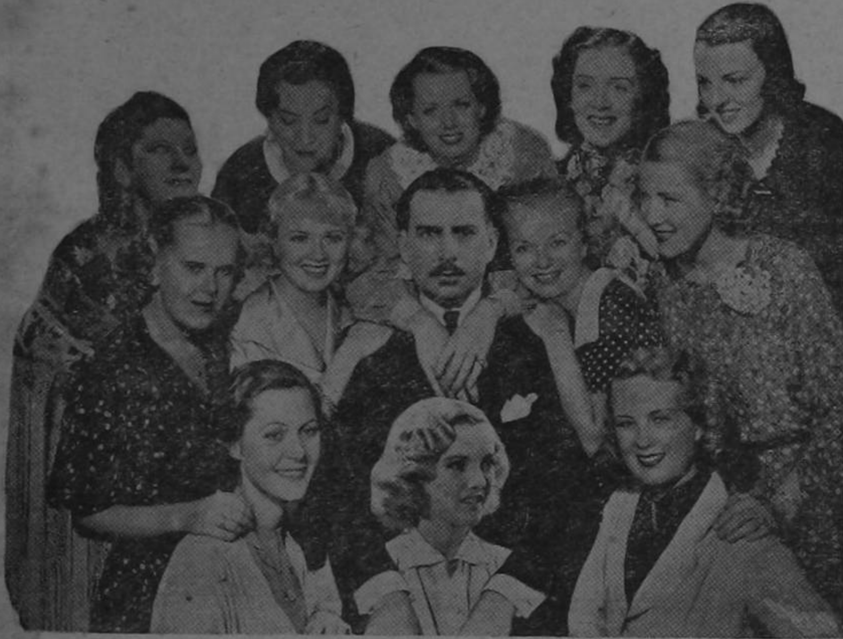
Esto no sólo es un buen partido, sino también una buena partida.

"Vibrantemente el Licenciado don Teodoro Picado defiende los derechos de la mujer costarricense." (De los diarios).